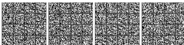
Tabella V.9-2: Compartimentazione